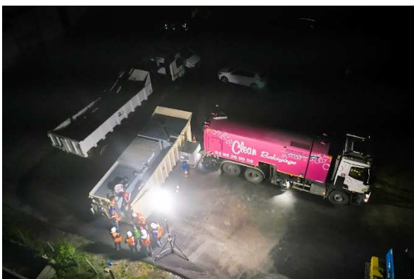
La balayeuse vide les eaux du chantier dans le dispositif de traitement