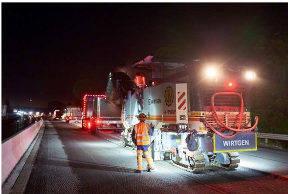
Les opérations de rabotage