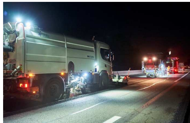
Les balayeuses en action