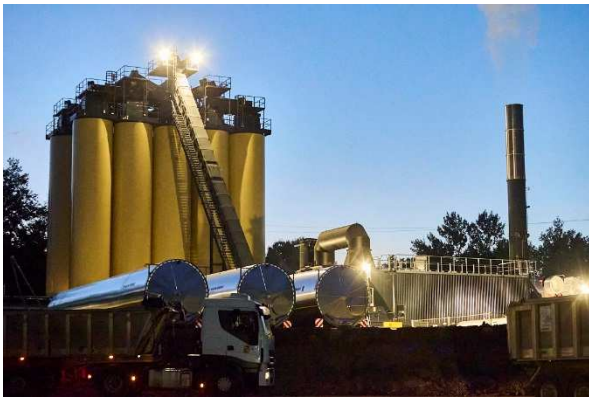
La centrale d'enrobés

Ce chantier a été l'occasion pour l'entreprise TRABET d'expérimenter pour la première fois en France un équipement innovant : la TSX 28, une centrale mobile d'enrobés nouvelle génération. Sa forte capacité de stockage a permis chaque nuit de mettre en œuvre d'importants volumes d'enrobés réduisant ainsi la durée du chantier.